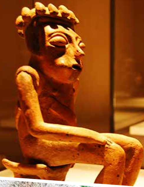
Bogotá - Museo del Oro