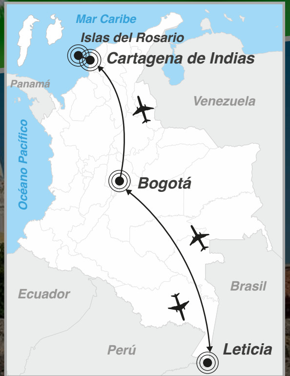
Cartagena de Indias

Bogotá - Leticia - Cartagena de Indias - Islas del Rosario